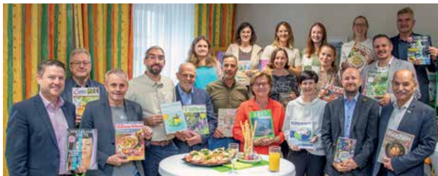
Die Städtische Bücherei Gmünd bedankte sich bei den Sponsoren, die es ermöglichen, ein reichhaltiges Zeitschriftenangebot in der Bücherei anzubieten.

Bäckerei Döllner: Kochen & Küche Autohaus Eder: Mein schöner Garten Stadtwirtshaus Hopferl: Gusto Apotheke z. Auge Gottes: natur & heilen RZA: ORF Nachlese Kosmetik Haumer: Koch & Back Raiffeisenbank Ob. W4: Servus AGRANA Stärke: Kraut & Rüben Team3: Welt der Wunder Frau Hofer: Kinderbücher Berger Print GmbH: Geo Shopping Ruzicka: Anna, Toniebox k:2 KG: Kinderbuchreihen. <<