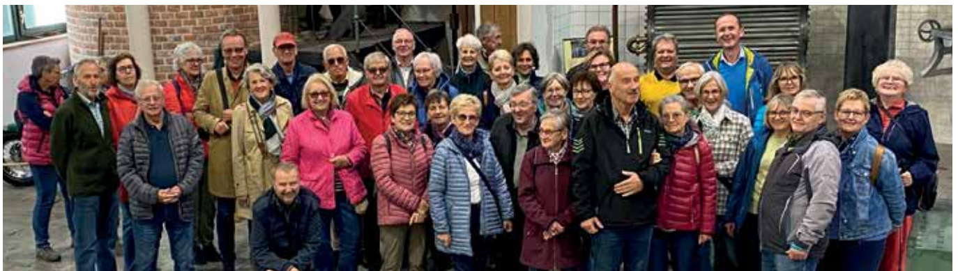
SENIORENAUSFLUG DER STADTGEMEINDE GMÜND Der Seniorenausflug der Stadtgemeinde Gmünd führte nach Pilsen. Am Programm stand neben einer Stadtführung auch eine Besichtigung der Brauerei. Im Bild ein Teil der 110-köpfigen Teilnehmerschar.

Karten für das Gospelkonzert (VVK: € 15,-, AK: € 18,-) gibt es im Bürgerservice der Stadt Gmünd. <<