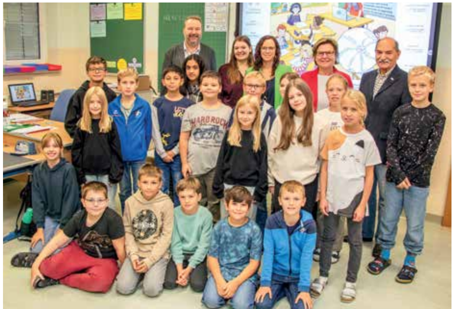
In den vierten Klassen der Volksschule Gmünd wurden Anfang September die beiden neuen Smartboards im Unterricht in Betrieb genommen.

Die Volksschule Gmünd erhielt erst vor einiger Zeit die Auszeichnung