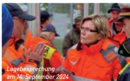
Lagebesprechung am 14. September 2024