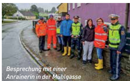
Besprechung mit einer Anrainerin in der Mühlgasse

Stadtgemeinde Gmünd zum Schutz der Bevölkerung wirksam und vor allem treffsicher waren. Durch die zusätzlichen Schutzmaßnahmen im Mündungsbereich von Lainsitz und Braunau, die Errichtung von Schutzdämmen sowie die ständige Lagebeobachtung haben vor allem auch die Mitarbeiter des Städtischen Wirtschaftshofes und Wasserwerkes die Stadt und die Bevölkerung vor großem Schaden geschützt und damit die Arbeit der Einsatzorganisationen wesentlich entlastet. Ich danke auch den Freiwilligen Feuerwehren, dem Roten Kreuz, dem Zivilschutzverband und der Polizei für die großartige Arbeit und Unterstützung!“ «