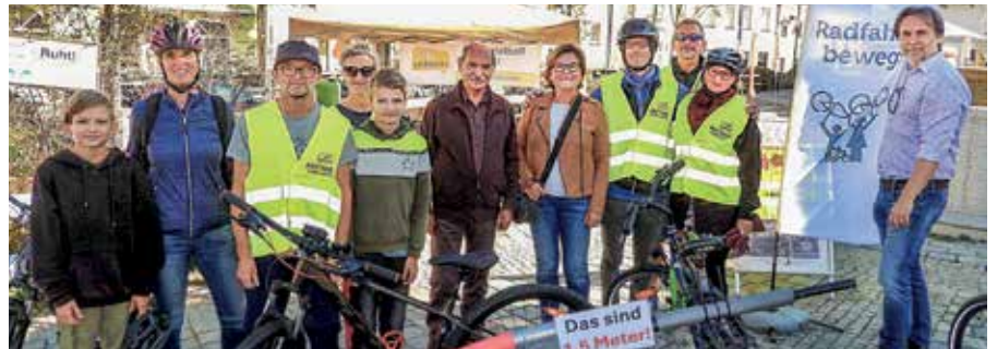
Im Rahmen der „Mobilitätswoche“ wurde auf den Mindestabstand beim Überholen von Radfahrenden hingewiesen, auch die „Gehzeit.Karte“ wurde dabei präsentiert.

Die „Gehzeit.Karte“ wurde im Rahmen der Europäischen Mobilitätswoche erstmals vorgestellt. Sie ist im Stadtamt Gmünd erhältlich und kann auch online auf der Website der Stadtgemeinde Gmünd abgerufen werden (siehe QR-Code). <<