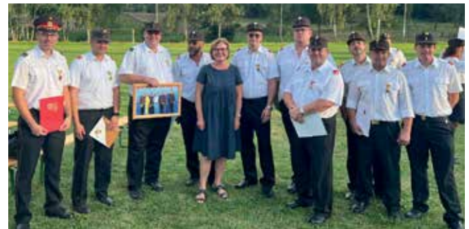
AUSZEICHNUNGEN Im Rahmen des Abschnittsfeuerwehrtages in Nondorf erhielten einige Kameraden der Gmünder Feuerwehren Auszeichnungen für ihre langjährigen Verdienste überreicht.