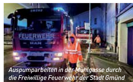
Auspumparbeiten in der Mühlgasse durch die Freiwillige Feuerwehr der Stadt Gmünd