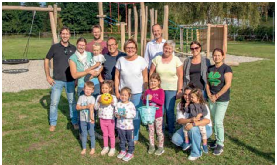
Kinder und Familien freuen sich über den neuen Spielplatz in Breitensee, der in den vergangenen Monaten von der Stadtgemeinde Gmünd errichtet wurde.

spielbereich mit Sonnensegel, eine Kletter- und Balancierstation, eine Breitrutsche, ein Kinderspielhaus mit Veranda sowie eine Doppelschaukel und eine Nestschaukel. Im Zuge der Arbeiten hat auch der Städtische Wirtschaftshof eine Reihe an Eigenleistungen in die Umsetzung eingebracht. «