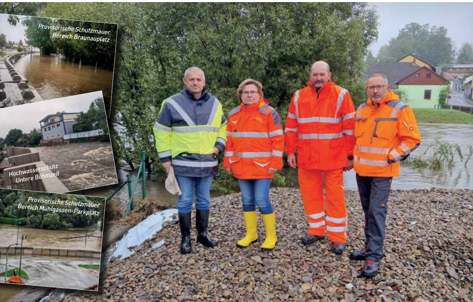
Provisorische Schutzmauer Bereich Braunauplatz