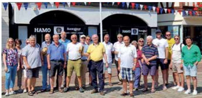
GMÜNDER TREFFEN Eine Abordnung der Stadtgemeinde Gmünd besuchte zusammen mit dem Männergesangsverein das Treffen der „Gmünder in Europa“ in Gemünden am Main (Deutschland).

Wenn Sie Wege vorschlagen und beim Ausmessen und Ausschildern mitmachen wollen, melden Sie sich per E-Mail: gmuend@radlobby.at . «