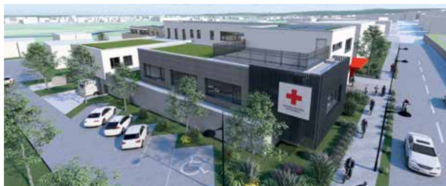
3D-Ansicht auf die künftige Gmünder Rotkreuz-Bezirksstelle mit Blick in Richtung Altstadt (rechts die Weitraer Straße mit Haupteingang, links die Johannes-Weinberger-Gasse mit Abfahrt in die Garage für die Einsatzfahrzeuge).