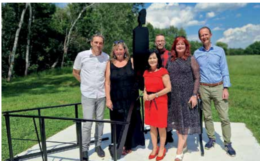
Im Rahmen der Gmünder „Kafka-Tage“ Anfang Juni wurde das Franz-Kafka-Denkmal am Fußgängerübergang in der Bleylebenstraße enthüllt.

Schriftsteller aus Prag kommend. Seine letzte Fahrt nach Prag nach seinem Tod 1924, wo er am jüdischen Friedhof in Prag-Olšany beigesetzt wurde, hat ihn noch einmal durch Gmünd geführt. <<