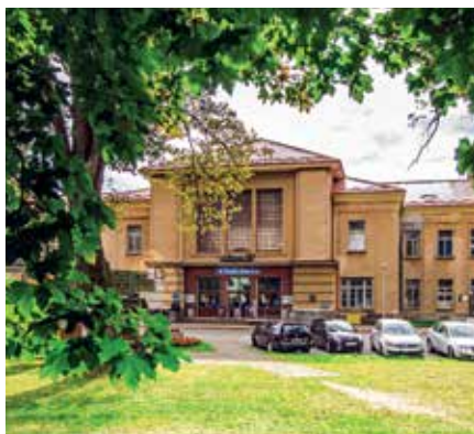
Auch der Bahnhof in Česká Velenice wird Schauplatz der Kafka-Tage sein.