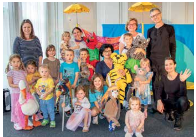
„SCHNECK & CO“ IM PALMENHAUS Viele Kinder und Familien tauchten in die Geschichte „Post für den Tiger“ ein und haben dabei ein lustiges Programm genossen.