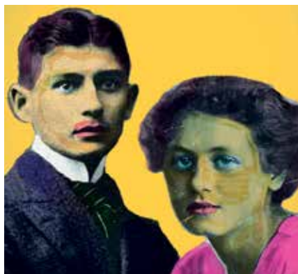
Franz Kafka und Milena Jesenská trafen sich im Sommer 1920 in Gmünd.