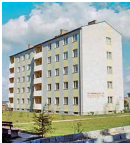
Der Dag-Hammarskjöld-Hof nach Fertigstellung vor 60 Jahren.

sowie den Einsatz von Fernwärme.“ Der Dag-Hammarskjöld-Hof wurde Anfang der 1960er-Jahre von der Stadtgemeinde Gmünd errichtet. Dag Hammarskjöld war bis zu seinem Tod 1961 Generalsekretär der Vereinten Nationen. Kurz nach seinem Tod wurde ihm der Friedensnobelpreis zugesprochen.