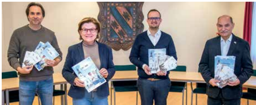
START DER TOURISMUS-SAISON Die Verantwortlichen der Stadtgemeinde Gmünd blicken positiv auf die anstehende Tourismus-Saison in der Stadt Gmünd. Im Jahr 2021 gab es trotz Pandemie einen Rekord-Sommer (die „Gmünder Stadtnachrichten“ berichteten).