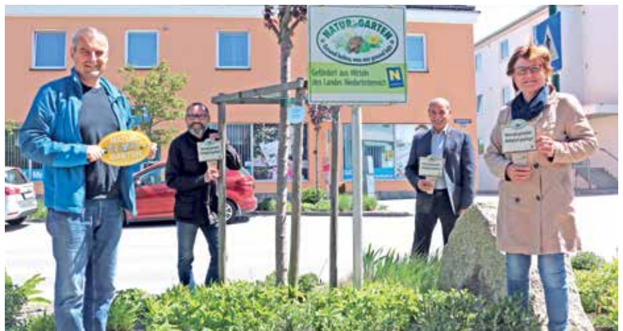
Gmünd ist seit einigen Jahren „Natur im Garten“-Gemeinde und wurde bereits mehrfach mit dem „Goldenen Igel“ ausgezeichnet. Auch viele Bürgerinnen und Bürger tragen durch ihr Engagement zu diesem ökologischen Erfolg bei.

Bürger betätigen sich nicht nur bei der Beseitigung von Unkraut, sie kümmern sich auch um ganze Grünflächen und Staudenbeete, wie zum Beispiel im Wasserfeld, der Czadekgasse oder der Sportplatzgasse. Ich möchte allen danken, die hier zu Werk gehen und gleichzeitig auch andere aufmuntern, diesem Beispiel zu folgen.“ Weitere Infos dazu gibt es in der Abteilung Bauwesen (Tel.Nr. 02852/52506-310). <<