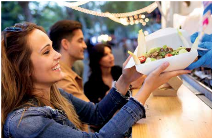
Am Pfingstweekende gastiert das „European Street Food Festival“ erstmals in Gmünd am Schubertplatz. Es ist neben Horn (im August) die einzige Station im Waldviertel.