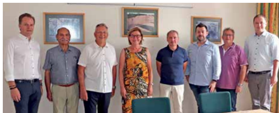
Gruppenfoto nach dem Informationsaustausch zwischen den Städten Gmünd, České Velenice und Bad Radkersburg.

tigstellung in den nächsten Wochen bzw. Monaten erfolgen soll. <<