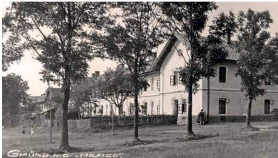
Als Arbeiterwohnungen für den Gmünder Bahnhof und die Eisenbahnwerkstätten wurde der Bau der Kolonie „Mexiko“ im September 1871 fertiggestellt.

weitläufige Anlage der Eisenbahnreparaturwerkstätte. Übrigens: „Mexiko“ ist nicht der einzige Name, der nach der Eröffnung der Franz-Josefs-Bahn den Klang der weiten Welt in die Region brachte. In der Nähe von Rapšach (früher als Rottenschachen zum Bezirk Gmünd gehörig) befinden sich heute noch kleine Siedlungen mit den klingenden Namen London, Paris und New York. «