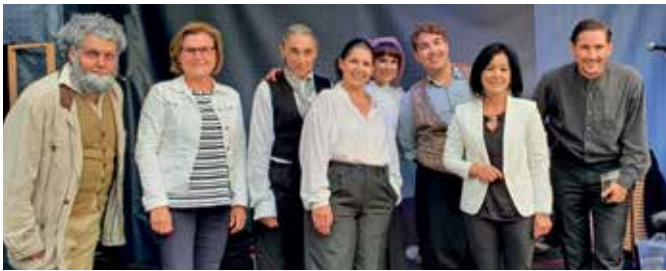
LKW-THEATER Mit der Nestroy-Komödie „Höllenangst“ gastierte das LKW-Theater Mitte Juni wieder am Gmünder Stadtplatz.