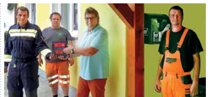
DEFIBRILLATOR IN BREITENSEE Auch beim Feuerwehrhaus in Breitensee befindet sich nun ein Defibrillator. Die Anbringung wurde von zwei Mitarbeitern des Wirtschaftshofes erledigt.