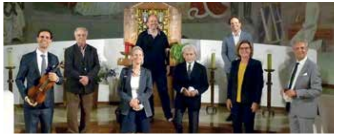
AUFTAKT VON „ALLEGRO VIVO“ Bereits zum zweiten Mal fand das Auftaktkonzert von „Allegro Vivo“ in der Herz-Jesu-Kirche statt.