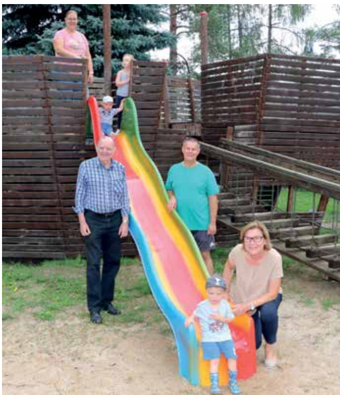
NEUE RUTSCHE AM SPIELPLATZ Bei der Spielgeräteüberprüfung im Vorjahr wurden bei der Wellenrutsche beim Kinderspielplatz der Kinderfreunde beim Harabruckteich Mängel festgestellt. Die Stadtgemeinde Gmünd ließ die Rutsche nun erneuern.

der Gesunden Gemeinde gelungen, auch 2021/22 neue und abwechslungsreiche Kursangebote in das Programm aufzunehmen.“ Weitere Exemplare der Kursprogramme erhalten Sie im Bürgerservice der Stadtgemeinde Gmünd, Schremser Straße 6, 3950 Gmünd (unter der Tel.Nr. 02852/52506-102). «