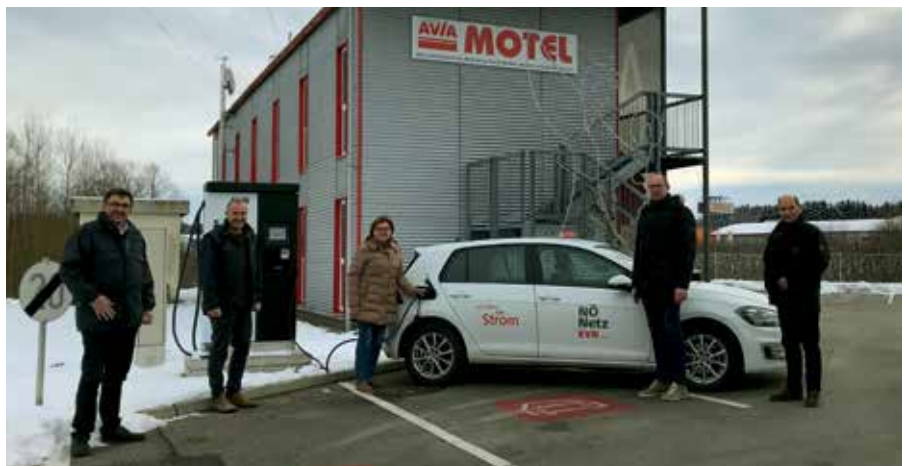
Die EVN hat vor einigen Wochen auf der AVIA-Station Gmünd eine neue 50KW-Schnellladestation in Betrieb genommen.

Stadtplatz wäre aufgrund des vorhandenen Leitungsnetzes nur unter unverhältnismäßigem Aufwand möglich) – Ladestationen mit einer Ladeleistung von mindestens 11 kW errichten. <<