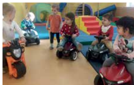
Vor einigen Wochen wurde der „Fuhrpark“ im Gmünder Kinderhaus erweitert.

sen zu genießen und anschließend im Ruheraum ihre wohlverdiente Pause einzulegen. Der monatliche Beitrag für die Betreuung richtet sich nach der jeweiligen Betreuungsdauer. Die Leitung des Kinderhauses informiert Sie gerne, auch über mögliche Förderungen.