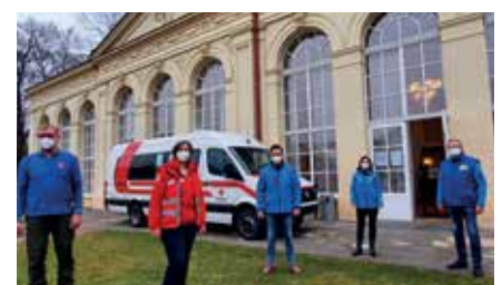
Blutspendeaktion am 2. Jänner 2021 im Gmünder Palmenhaus.

Wenn Sie Mitarbeiter des Zivilschutzverbandes werden möchten, steht Ihnen die Gmünder Ortsleitung unter der Tel.Nr. 02852/52506-310 für weitere Informationen zur Verfügung. «