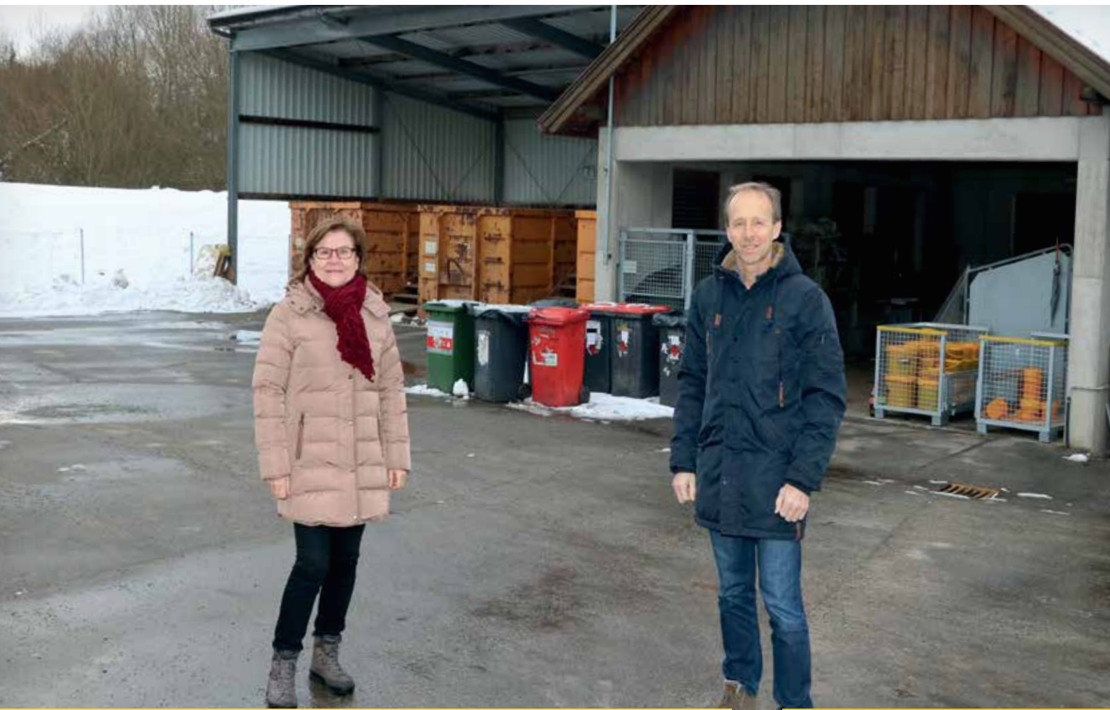
Freuen sich auf die Umsetzung des Zutrittssystems im ASZ Hoheneich-Gmünd (von links): Gmünds Bürgermeisterin Helga Rosenmayer und Hoheneichs Bürgermeister Christian Grümeyer.