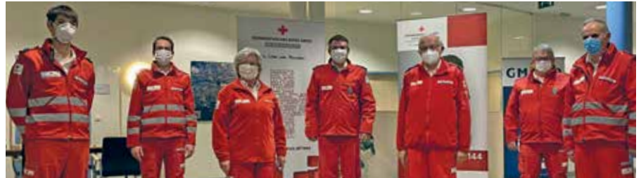
Die Bezirksstellenleitung des Roten Kreuzes Gmünd blickt auf ein herausforderndes Jahr 2020, das ganz im Zeichen der Corona-Pandemie stand, zurück.

Während des ersten Lockdowns im Frühjahr kam es gleichzeitig zu starkem Rückgang der Krankentransporte, weil der Routinebetrieb in den Spitälern und bei den Fachärzten massiv eingeschränkt wurde. So ist auch die Gesamtanzahl der Rettungs- und Sani-