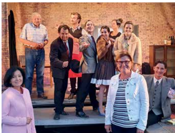
LKW-THEATER Mit dem Stück „Wirbel um die Wirtin“ gastierte das LKW-Theater Mitte Juli am Stadtplatz. Es handelte sich um die erste Kulturveranstaltung seit Beginn der Corona-Pandemie.