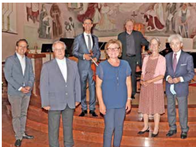
AUFTAKT VON ALLEGRO VIVO Der traditionelle Auftakt für das Festival von „Allegro Vivo“ fand heuer in der Herz-Jesu-Kirche in Gmünd-Neustadt statt.

Das Projekt „Waldviertel eingekocht“ wird von der Kleinregion Waldviertler StadtLand mit finanzieller Unterstützung des Förderprogramms LEADER durchgeführt und möchte traditionelles Wissen erhalten, einen positiven Beitrag zum Klimaschutz aber auch zur regionalen Selbstversorgung leisten. <<