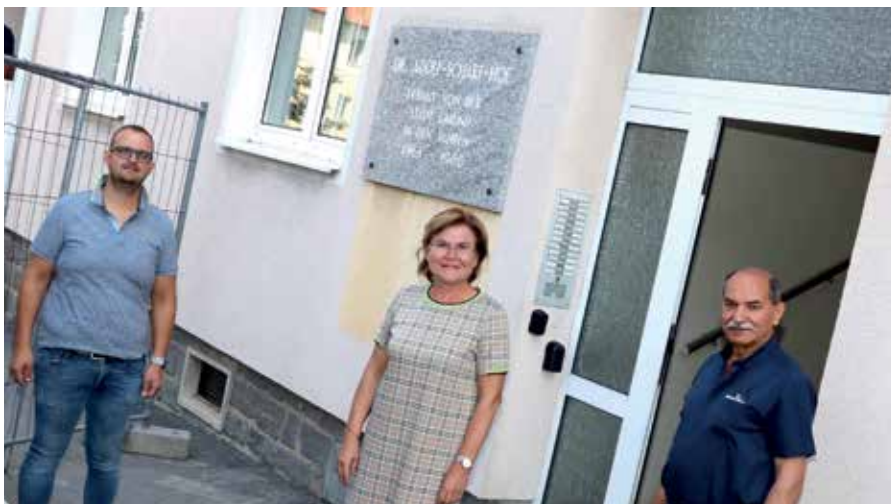
SANIERUNG GEMEINDEWOHNHAUS Derzeit wird das Gemeindefohnhaus in der Bahnhofstraße 25 saniert. Die Gesamtkosten betragen rund 1,2 Millionen Euro.