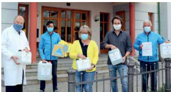
Für den Kindergarten Gmünd-Stadt spendeten die „Apotheke zum Auge Gottes“ und die Fa. Berger Print Desinfektionsmittel.