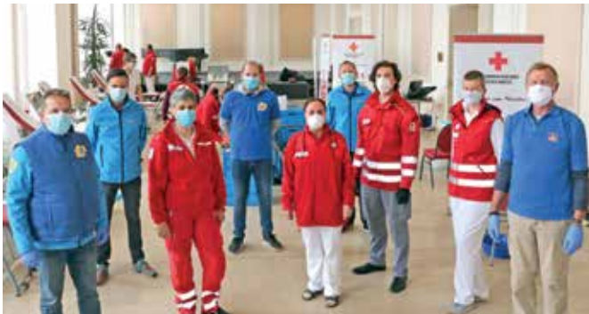
Die Blutspendeaktion des Roten Kreuzes fand Anfang Mai mit Unterstützung des Zivilschutzverbandes statt.