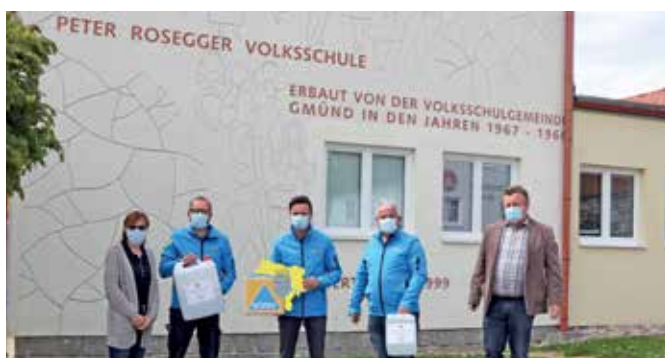
Die Desinfektionsmittel der Firma Agrana wurden auch der Volksschule Gmünd übergeben.