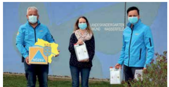
Übergabe von Hände- und Flächendesinfektionsmittel an den Landeskindergarten Gmünd-Wasserfeld.