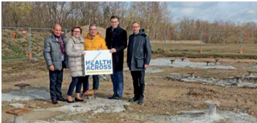
Baustellenbesichtigung Anfang März 2020 am Gelände des Healthacross-Gesundheitszentrums in Gmünd. Nun wurden die weiteren Arbeitsvergaben beschlossen.

Andererseits wurden im Jahr 2019 Tilgungen in der Höhe von € 2.431.397,63 durchgeführt.