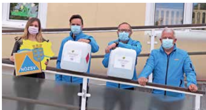
Auch das Kinderhaus Gmünd nahm Desinfektionsmittel für den laufenden Betrieb sehr gerne in Empfang.