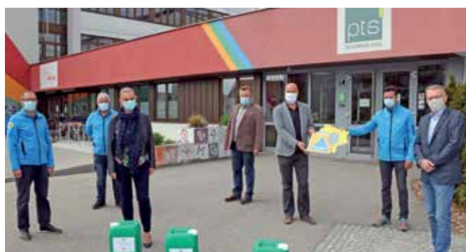
Übergabe an das Schulzentrum Gmünd, die Polytechnische Schule sowie die Neue Mittelschule (Sportmittelschule).