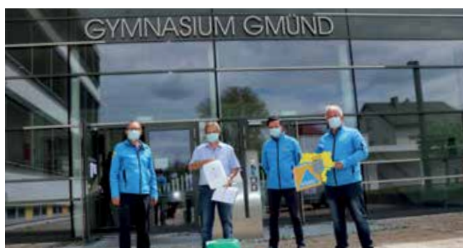
Dem Gymnasium Gmünd wurden Flächen- und Händedesinfektionsmittel von der Firma Agrana übergeben.