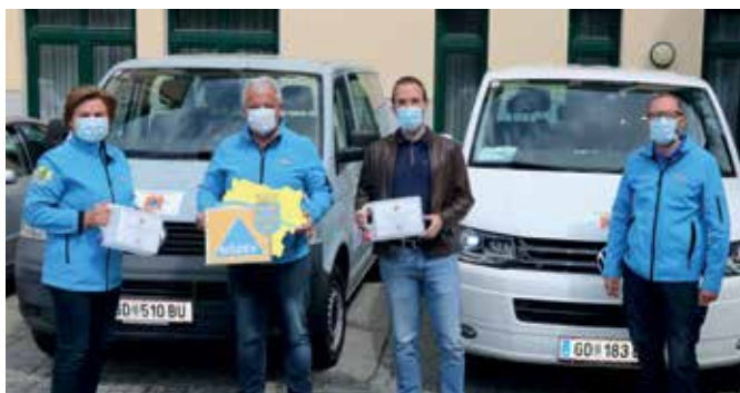
Übergabe von Desinfektionsmittel der Firma Agrana an das Kinderschutzzentrum Gmünd „Kidsnest“.