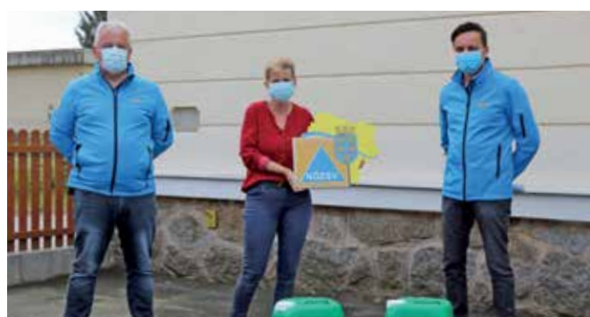
Übergabe von Hände- und Flächendesinfektionsmittel an den Landeskindergarten Gmünd-Eibenstein.