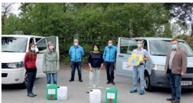
Desinfektionsmittelübergabe an das Sonderpädagogische Zentrum sowie den Kindergarten Gmünd-Neustadt.