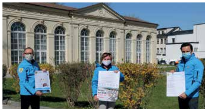
Informationskampagne des Zivilschutzverbandes und der Stadtgemeinde Gmünd zu den Corona-Schutzmaßnahmen.