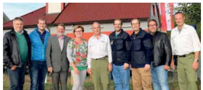
HEURIGER DER FEUERWEHR GMÜND-EIBENSTEIN Die Feuerwehr Gmünd-Eibenstein lud wieder zum traditionellen Feuerwehreurigen beim Feuerwehrhaus ein.