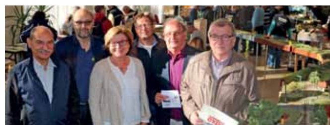
SCHMALSPUREXPO Anfang Oktober 2018 ging in Gmünd die Schmalspur-Expo über die Bühne. Modellbahnaussteller und hunderte Interessierte waren in Gmünd unterwegs.