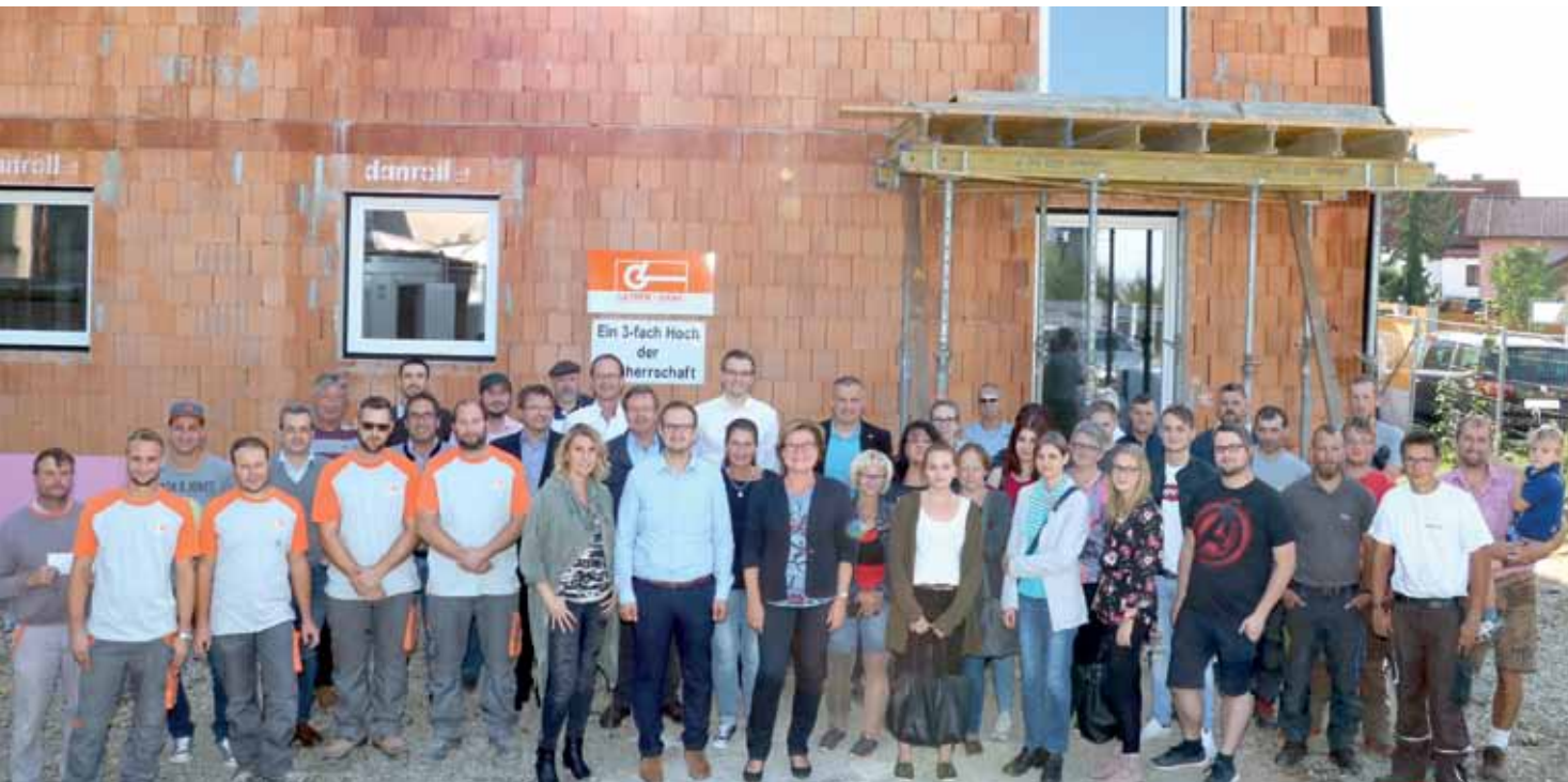
Insgesamt 16 neue Gemeindewohnungen werden derzeit entlang der Weitraer Straße errichtet. Verantwortliche der Stadtgemeinde, der Baufirmen sowie künftige Mieter versammelten sich am 28. September zur Gleichfeier auf der Baustelle.