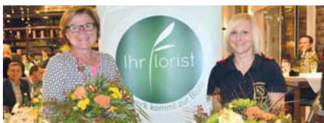
STAATSMEISTERSCHAFTEN In Gmünd zeigten am 6. und 7. Oktober 2018 Österreichs beste Floristen ihr Können bei den Staatsmeisterschaften im Hotel Sole-Felsen-Bad.