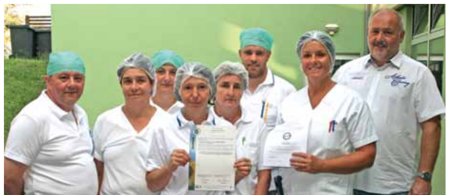
Bestnoten gibt es erneut für die Küche des Gmünder Landeskrankenhauses. Vom engagierten Küchenteam kommen auch die Speisen für die Aktion „Essen auf Räder“.