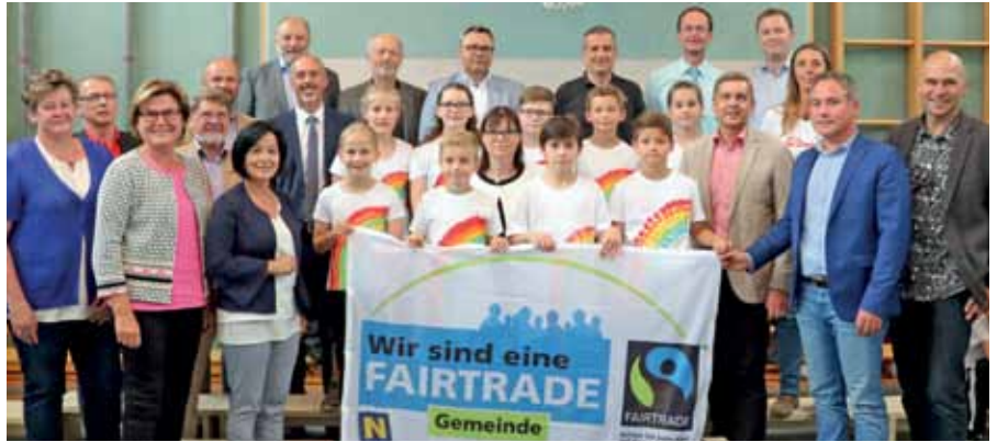
Nach dem Festakt zu „50 Jahre Volksschule Gmünd“ sowie der Zertifikatsverleihung „Fair-Trade-Gemeinde“ stellten sich Ehrengäste sowie Schüler zum Gruppenfoto auf.