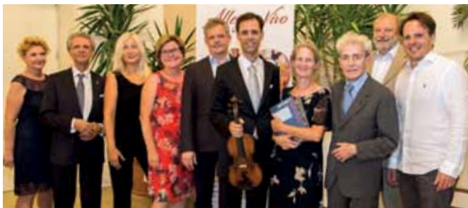
AUFTAKT VON ALLEGRO VIVO Das Auftaktkonzert im Palmenhaus stand heuer, heuer mit einer Welturaufführung, im Zeichen des 40-Jahr-Jubiläums von „Allegro Vivo“.

Weitere Kulturprogramme erhalten Sie bei der Stadtgemeinde Gmünd sowie in digitaler Form auf unserer Website www.gmuend.at .