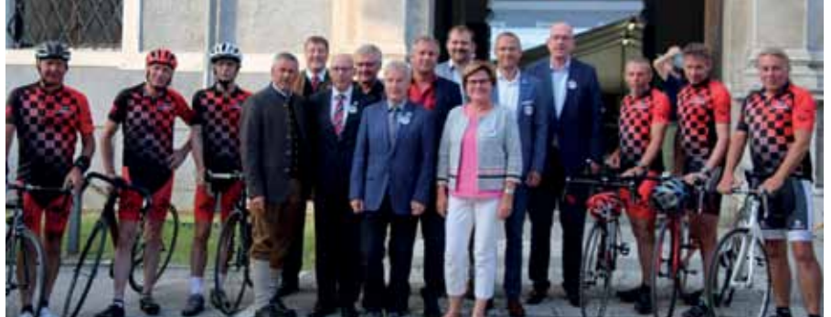
Aus ganz Europa kamen Gmünder zusammen, um sich in Gmünd in Kärnten zum Städtetreffen der „Gmünder in Europa“ zu versammeln.

Europa von unten bauen – dieses Ziel verfolgt die Städtegemeinschaft der „Gmünder in Europa“. Zum offiziellen Treffen versammelten sich Vertreter aus allen neun Mitgliedsgemeinden mit insgesamt 14 amtierenden und ehemaligen Bürgermeister in Gmünd in Kärnten. Höhepunkt des Wochenendes war der Europa-Abend im Hof des Schlosses Lodron, zu dem alle neun Mitgliedskommunen