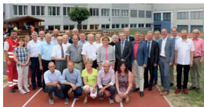
SCHULFEST ZUM MITTELSCHULJUBILÄUM Zum 40. Bestandsjubiläum der Neuen Mittelschule 1 gab es ein Schulfest sowie die Eröffnung der generalsanierten Schulsportanlage.