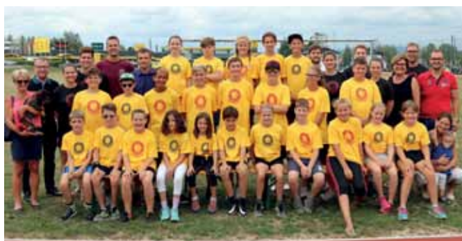
SOMMERCAMP DES UBBC GMÜND Das Sommercamp des UBBC Gmünd war ein großer Erfolg. Insgesamt tobten sich über 80 Kinder bei Spiel, Sport und zahlreichen Specials aus.