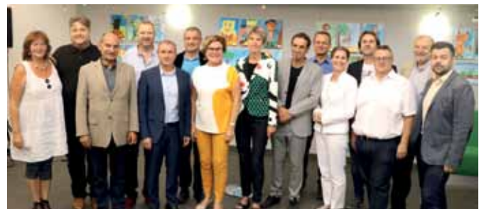
ÜBERGÄNGE - PŘECHODY 2018 Das Programm und das außergewöhnliche Konzept des diesjährigen Festivals löste einen neuen Rekord-Besuch in Gmünd und České Velenice aus.