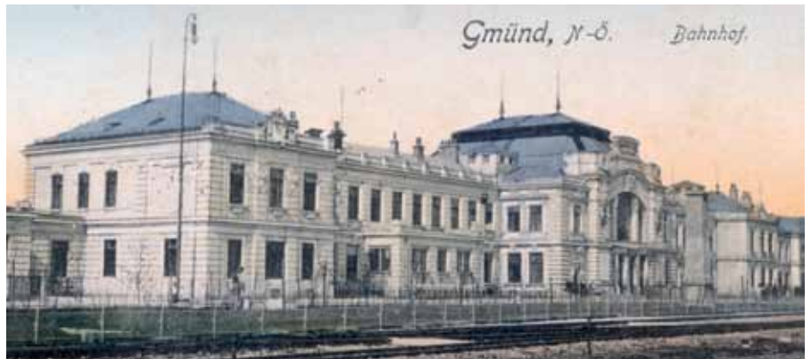
Der „Tag des Denkmals“ zeigt am 20. September 2018 in Gmünd Erinnerungsorte des Jahres 1918 und widmet sich Gmünd und dem Ende des Ersten Weltkrieges.

Das 20. Jahrhundert hat die Stadt Gmünd geprägt wie kaum eine andere Stadt in Österreich. Aufgrund der zentralen Lage wurde Gmünd 1914 als Standort für eines der größten Flüchtlingslager der Monarchie ausgewählt. Das Ende des