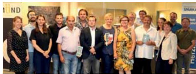
AUSSTELLUNG IM STADTAMT GMÜND Die „Waldviertel Akademie“ war mit ihrem Viertelsfestival-Projekt der „Lebens(T)raum Waldviertel“ im Rathaus Gmünd zu Gast.