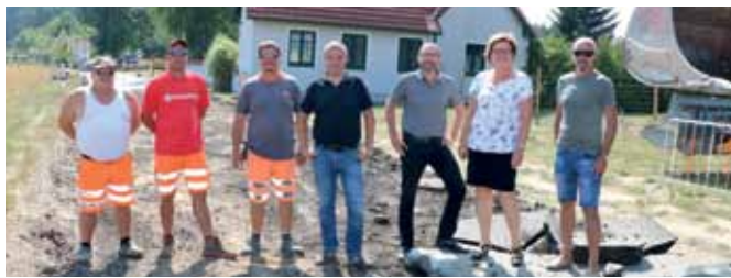
NEUER FAHRBAHNTEILER Zur Erhöhung der Verkehrssicherheit wird derzeit bei der Ortseinfahrt Kleineibenstein (aus Richtung Breitensee kommend) ein Fahrbahnnteiler errichtet.