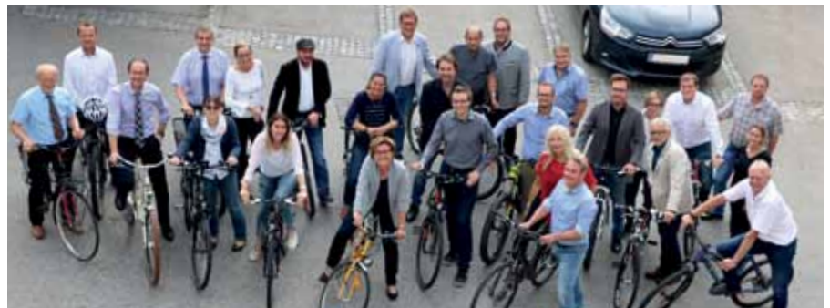
GEMEINDE-RAD-SITZUNG Die Sitzung des Gemeinderates der Stadt Gmünd stand im Zeichen der Aktion der Klimabündnis-Aktion „GemeindeRADsitzung“: Sämtliche Mandatare fuhren mit dem Fahrrad zur Gemeinderatssitzung.

Der Wunsch der Musikschule Gmünd war der Ankauf eines E-Pianos für den Standort Gmünd-Neustadt. Das bestehende Pianino war über 40 Jahre in der Musikschule im Einsatz und deshalb in einem schlechten Zustand. Außerdem war das Pianino ständig verstimmt. Es wurde nun ein E-Piano Yamaha Hybrid NU1X bei der Firma Musikhaus Karl Danner GmbH um € 4.279,20 angeschafft. <<