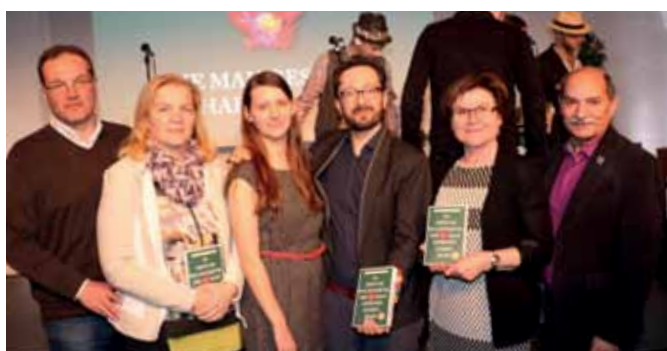
BUCHPRÄSENTATION Bei der Buchpräsentation von „111 Orte im Waldviertel die man gesehen haben muss“ wurden auch sehenswerte Orte aus der Stadt Gmünd präsentiert.