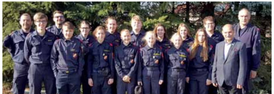
Unter den Teilnehmern des Wissenstests der Feuerwehrjugend des Bezirkes Gmünd befanden sich auch 10 Mitglieder der Feuerwehrjugend der FF Stadt Gmünd.

Die Stadtgemeinde Gmünd gratuliert allen Teilnehmern und Mitgliedern der Feuerwehrjugend der Feuerwehr der Stadt Gmünd zu den erbrachten Leistungen. «