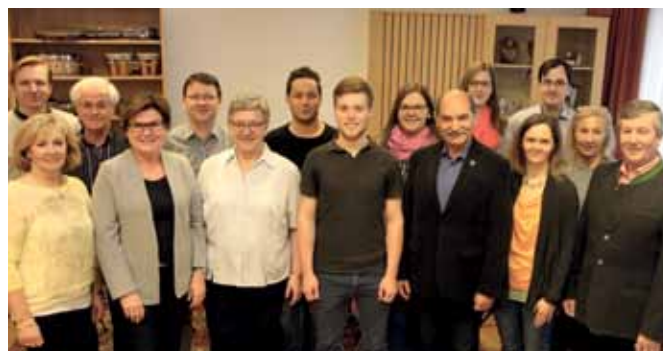
VERSAMMLUNG DER STADTKAPELLE Die Stadtkapelle Gmünd blickte ihm Rahmen der Jahreshauptversammlung auf das abgelaufene Jahr zurück.