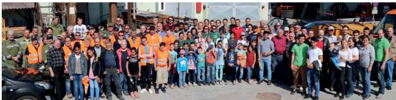
UMWELTAKTION IN DER STADT GMÜND In der Stadtgemeinde Gmünd waren wieder zahlreiche freiwillige Helfer im Rahmen der Umweltaktion „Wir halten Niederösterreich sauber“ unterwegs. Sie säuberten Wald, Wiesen und Bäche von Müll und Unrat.

Sein Leben stand, wie auf seiner Trauerpartie geschrieben wurde, im Dienste der Allgemeinheit, seiner Familie und Freunde. Gmünd verliert in ihm einen großartigen Menschen, der mit seinem Engagement Werte wie Nächstenliebe, Hilfsbereitschaft und den Sinn für das Gemeinwohl vor Augen hatte. <<