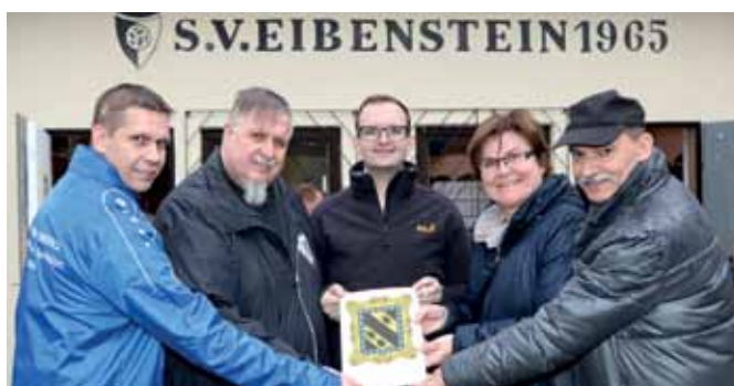
STADTWAPPEN FÜR SV EIBENSTEIN Dem SV Eibenstein wurde nach dem entsprechenden Gemeinderatsbeschluss vom 19. März 2018 symbolisch das Stadtwappen überreicht.

Mehr Informationen zur Kleinregion Waldviertler StadtLand finden Sie unter www.waldviertler-stadtland.at .