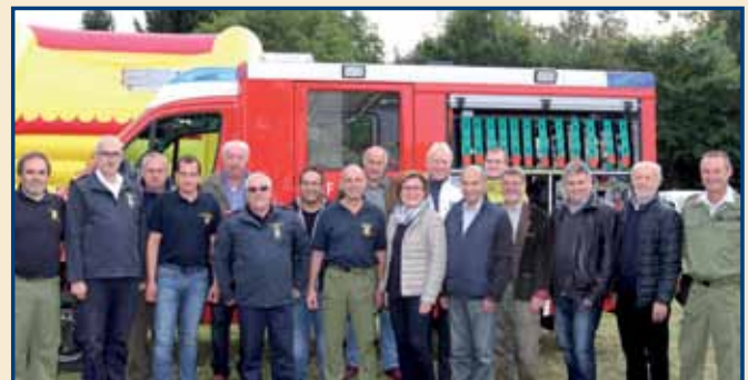
Heuriger der FF Gmünd-Eibenstein. Die Feuerwehr Gmünd-Eibenstein lud zu einem Tag der offenen Tür und zum Heurigen in ihr Feuerwehrdepot.