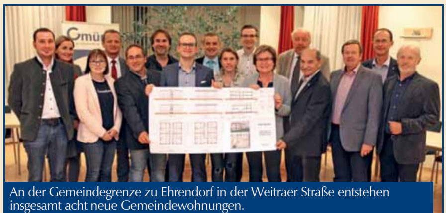
An der Gemeindegrenze zu Ehrendorf in der Weitraer Straße entstehen insgesamt acht neue Gemeindewohnungen.

Die geplanten Wohneinheiten, die von der Stadtgemeinde Gmünd gebaut und verwaltet werden, sollen aus einer Wohnküche, Schlafzimmer, einem Kinderzim-