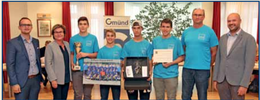
Sportehrenzeichen. Das Fußballteam der Polytechnischen Schule Gmünd hat im vergangenen Schuljahr den 1. Platz bei der NÖ Landesmeisterschaft belegt. In der vergangenen Gemeinderatssitzung wurde die Überreichung nachgeholt.