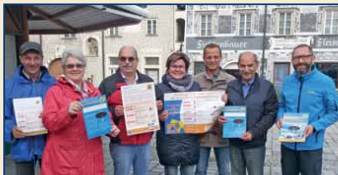
Zivilschutztag. Der Niederösterreichische Zivilschutzverband informierte am 7. Oktober zum Zivilschutztag am Gmünder Stadtplatz zum Thema Zivilschutz.