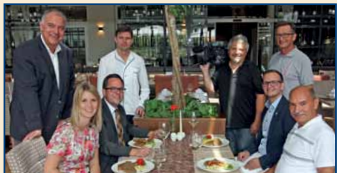
ORF III drehte im Sole-Felsen-Bad. Für einen ORF III-Spot von „Österreich hat Geschmack“ war ein Filmteam zu Gast in der Stadt Gmünd und im Sole-Felsen-Bad.