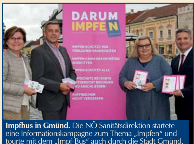
Impfbus in Gmünd. Die NÖ Sanitätsdirektion startete eine Informationskampagne zum Thema „Impfen“ und tourte mit dem „Impf-Bus“ auch durch die Stadt Gmünd.

und 17:00 Uhr, auch einen Modellbauflorhmarkt in der Fahrzeughalle. Anmeldungen sind ab Sonntag, dem 1. Oktober 2017, ab 9:00 Uhr unter der Tel.Nr. 02852/83157 möglich. Unter dieser Nummer gibt es auch Infos zu den Stellplätzen und Standgebühren. ■