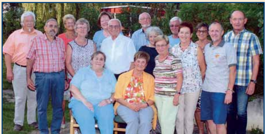
Der Vorstand des Gmünder Siedlervereines freut sich über neue Mitglieder und Personen, die im Verein Verantwortung übernehmen wollen.