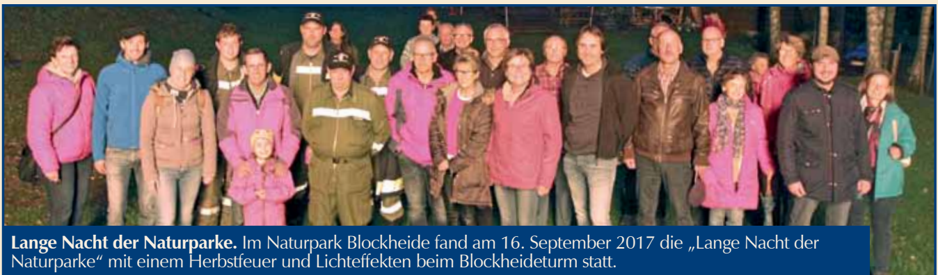
Lange Nacht der Naturparke. Im Naturpark Blockheide fand am 16. September 2017 die „Lange Nacht der Naturparke“ mit einem Herbstfeuer und Lichteffekten beim Blockheideturm statt.

Der Heizkostenzuschuss ist bis zum 30. März 2018 (einlangend) beim zuständigen Gemeindeamt zu beantragen, die Auszahlung erfolgt durch das Amt der NÖ Landesregierung. Den Heizkostenzuschuss können Landesbürger erhalten, deren monatliche Brutto-Einkünfte den Ausgleichszulagenrichtsatz gemäß § 293 ASVG nicht überschreiten. Bei der Beantragung ist die E-Card vorzulegen. ■