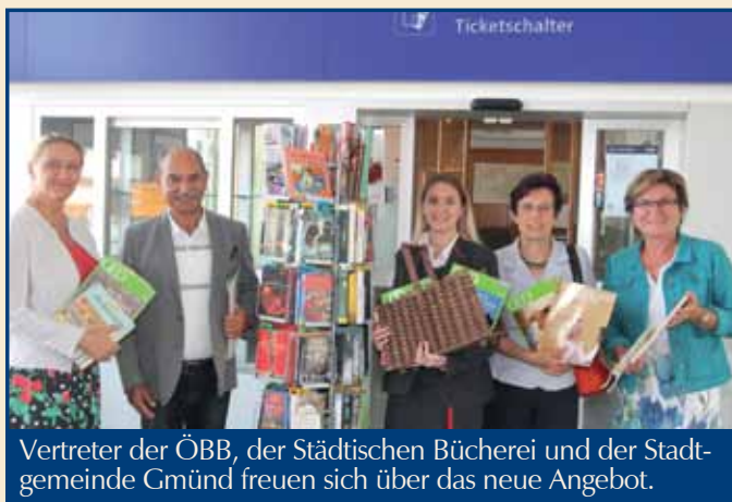
Vertreter der ÖBB, der Städtischen Bücherei und der Stadtgemeinde Gmünd freuen sich über das neue Angebot.