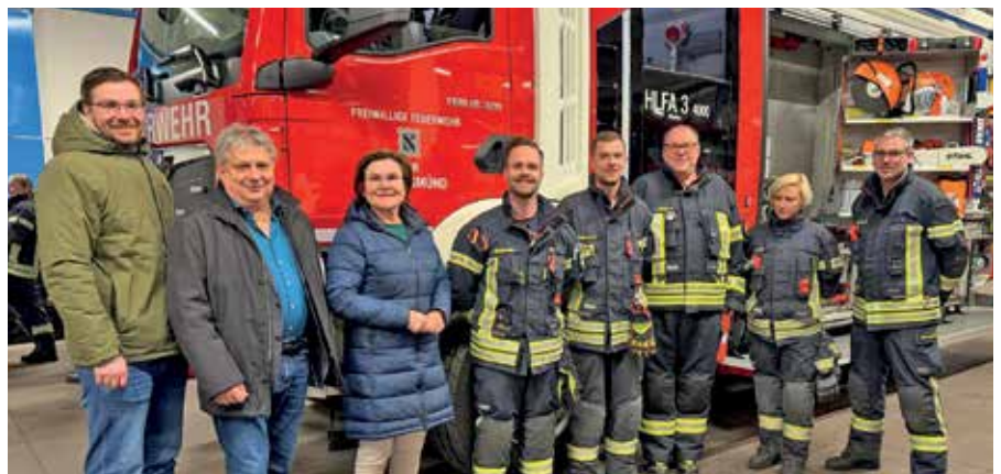
Mitglieder der Freiwilligen Feuerwehr der Stadt Gmünd gemeinsam mit Vertreterinnen und Vertretern der Stadtgemeinde bei der offiziellen Übernahme des neuen HLF 3.

Die Gesamtkosten für die Anschaffung belaufen sich auf rund € 640.000,--, durch Förderungen, die Umsatzsteuer-Erstattung sowie Eigenmittel der Freiwilligen Feuerwehr konnte der Anteil der Stadtgemeinde Gmünd auf rund € 288.000,-- reduziert werden. <<