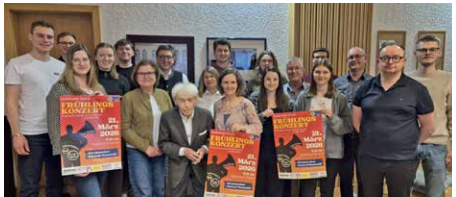
Generalversammlung der Stadtkapelle Gmünd: Derzeit zählt die Stadtkapelle 64 Musikerinnen und Musiker, davon 40 Männer und 24 Frauen.