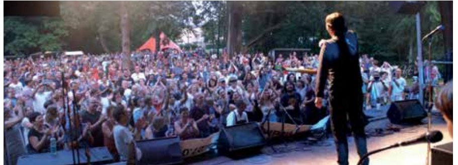
Im Rahmen des Festivals „Übergänge/Přechody“ wird auch der Schlosspark in Gmünd wieder zur Bühne für zahlreiche Acts.

Kunst und Kultur beleben dabei zahlreiche Orte der beiden Städte: vom Schlosspark über den Skaterplatz und die Kastanienallee bis zum historischen Bahnhof, vom Stadtplatz bis zu den Kirchen. Unterschiedlichste Schauplätze werden so zu Bühnen für Begegnung, Kreativität und Austausch. Das Programm reicht von Puppentheater, Ausstellungen und Workshops bis zu Kulturspaziergängen, spektakulären Performances und Radexkursionen. Auch ein Kletter-