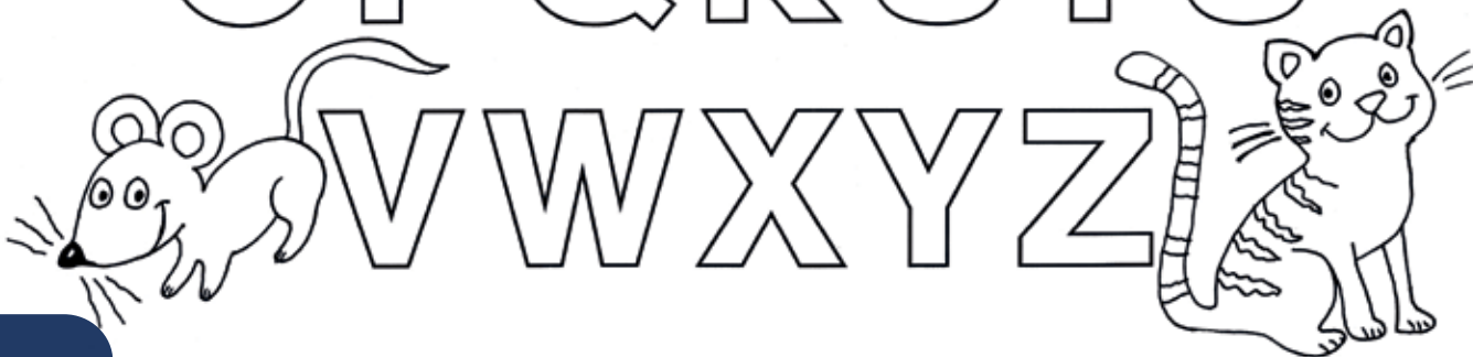
Illustration: Helga Bansch Buchstart Österreich ( www.buchstart.at )