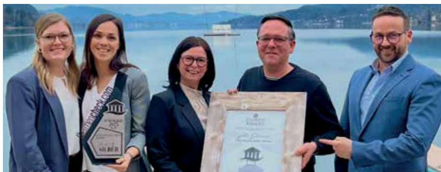
Bei der Wahl zur beliebtesten Therme Österreichs sichert sich die Waldviertler Wohlfühloase den zweiten Platz. Sie gehört damit offiziell zu den Top-Thermen des Landes.

Zum 20-jährigen Jubiläum gibt es besondere Aktionen, exklusive Geschenke und attraktive Ermäßigungen. «